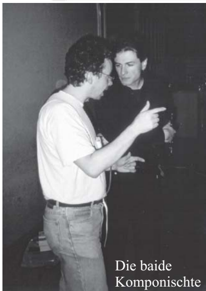
Die baide Komponischte

Grad bin y haimkoo vom Charlie Chaplin Trainings Weekend. Aigentlig hätt y jetzt ganz gärn welle d Fiess uff ere Streggbangg in die richtigi Richtig zruggbiege und d Aerm wiider emool aabenäh, aber nyt do. My Chef hett gsait, är bruuchi dä Bricht bis iibermorn. Henu also denn. Aagfange hetts aigentlig ganz gmietlig, erscht am Noomidaag vom Samschtig hämmer ys miesse an dr Schiffländi besamme. Z schlebbe hämmer usser den Inschtrumänt und