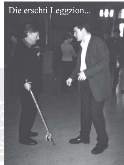
Die erschi Leggzion...

Nach em Warmpffaffen- und Drummle sin die einzelne Stimme